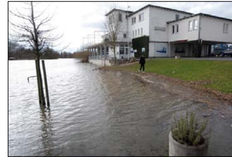
Nasse Füße fürs HRG-Bootshaus: Die Schneeschmelze hat Ende Februar die Pegel am Main ansteigen lassen und das Vereinsgelände teilweise überflutet. Den Höhepunkt erreichte das Hochwasser am 1. März.