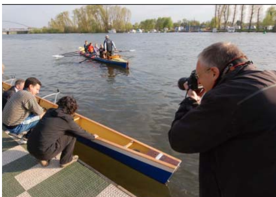
Bitte lächeln: Beim Pressetermin der „Frankfurter Rundschau“ wurde alles abgeleuchtet und aufgeschrieben – von Rolf Oeser und Redakteurin Ute Vetter

Ein hörbarer Platsch unterbricht die Aktion. Ein Mann stürzt über den Bootsrand hinaus und kopfüber bis zur Hüfte in den Main. Gut, dass Helfer auf dem Steg sind. Sie packen blitzschnell seine Beine und ziehen ihn hoch. Gut auch, dass unserer Vierer kein kippeliges Rennboot ist, sondern ein gemütlicher Kahn, stabil und breit. „Gig-Boot“ heißt diese Variante, die sich für mehrtägiges Wanderrudern eignet.