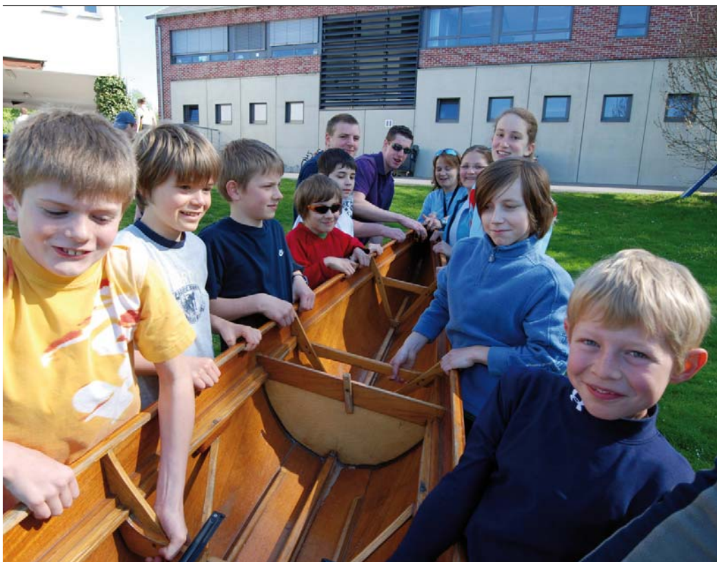
Gemeinsam geht es besser: Nach dem Schnuppern wurde kräftig angepackt