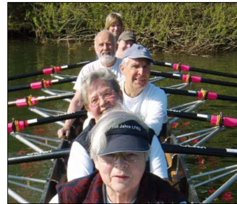
Selten war ein Tag so perfekt zum Anrudern wie dieser Sonntag am 18. April. Ein Achter, ein Vierer und ein Dreier machten sich auf in Richtung Großauheim. Mitglieder der Möve waren in einem Dutzend Booten unterwegs in Richtung ihres Bootshauses und so konnten die HRG'ler den letzten Teil der Auffahrt gemeinsam im großen Pulk in toller Atmosphäre erleben.