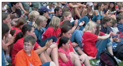
So war es 2007: „Jugend trainiert für Olympia“ am HRG-Bootshaus

Wer mithelfen möchte, kann sich in die Listen eintragen, die am Bootshaus aushängen beziehungsweise eine E-Mail an HanauerRegattaverein@web.de schicken.