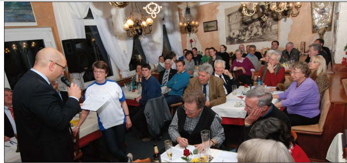
Modenschau: Im Bootshaus wurde auch die neue Vereinskleidung präsentiert

Bitte keine Wertgegenstände in den Umkleiden liegen lassen! Entweder lasst diese zu Hause, oder fragt einen Ruderkollegen, ob er es für euch einschließt. Mit dieser Maßnahme sollte alles sicher sein.