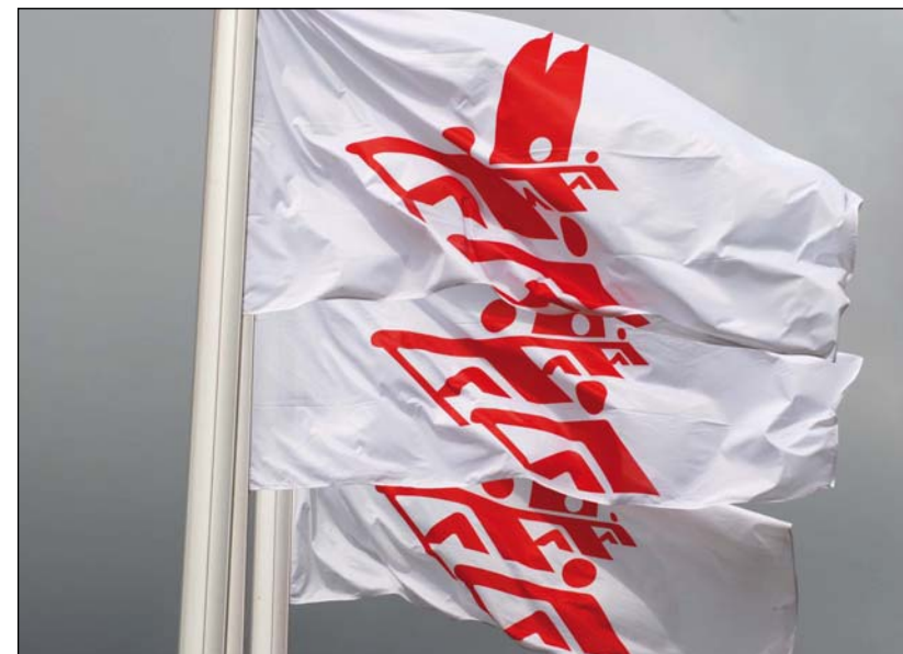
Herzlich willkommen: Die HRG-Kinder waren zu Gast auf der Regattastrecke Köln Fühlinger See