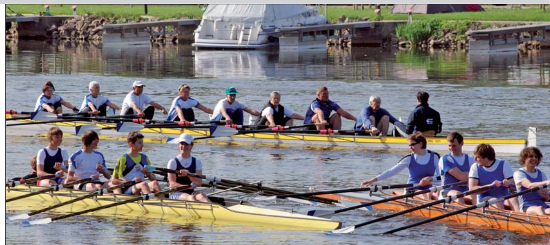
Anrudern: Der Start ist geglückt. Ziel war das Bootshaus des RC „Möve“ Großauheim