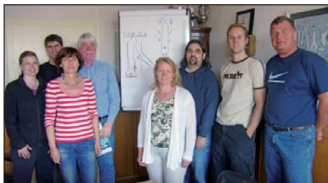
Jetzt fit am Steuer: Die Lehrgangsteilnehmer