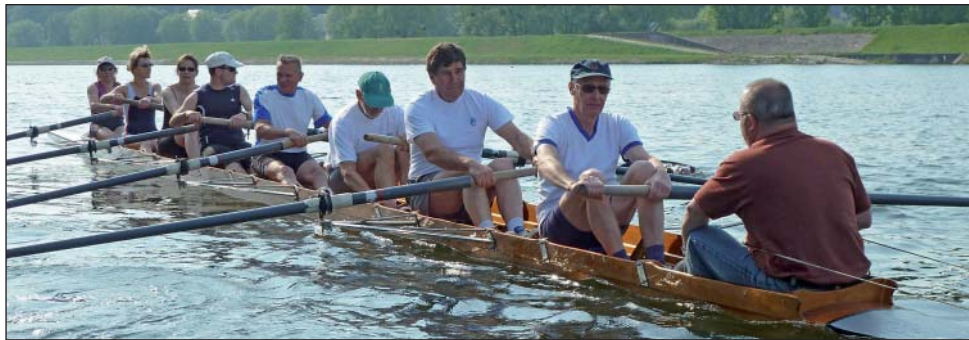
Einstimmung auf erlebnisreiche Tage: Das erste Achtertraining auf der Cher

Nachdem wir die Boote für die am nächsten Tag anstehende Loire-Fahrt aufgeladen hatten, fuhren wir in die Stadt Tours. Dort besichtigten wir im 20-Minuten-Takt die Altstadt, den Place du Plum'reau