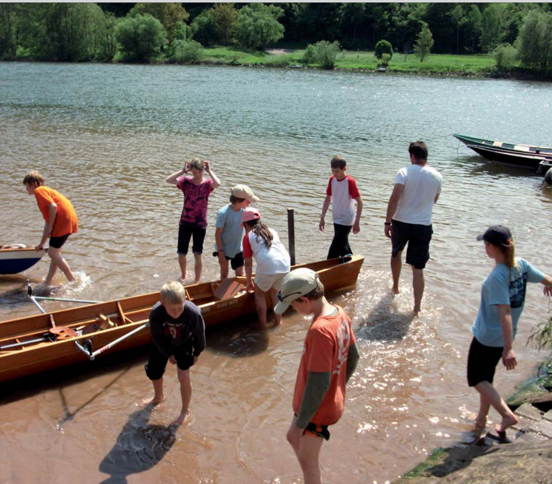
Das An- und Ablegen war für die Kinder eine erfrischende Angelegenheit

Spurttechnik, um für diese eine ideale Ausgangslage zu bekommen.