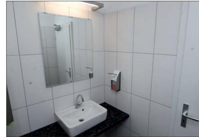
Hell, freundlich: Der Sanitärbereich erstrahlt in neuem Glanz

schwebte da schon lange eine Modernisierung vor Auge. Die Schließung seines Natursteinbetriebes im Zuge des Neubaus des Postcarre's nahm er zum Anlass, die Treppenstufen mit einem neuen Marmorbelag zu versehen und, da das Gelände nun auch nicht mehr passte, gleich ein Neues aus Edelstahl zu stiften (dazu möchte ich auf den gesonderten Artikel unseres Vor-