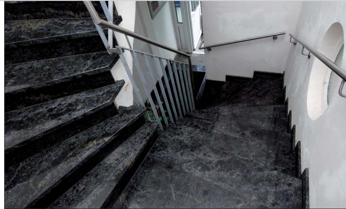
Moderner Look: neue Stufen und neues Geländer. Die restliche Renovierungsarbeiten des Treppenhauses werden auf den Winter verschoben